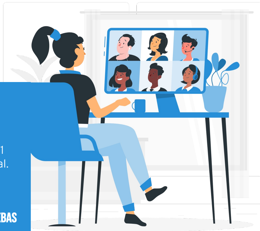
Illustration by Storyset .

ALGUIEN QUE PUEDA INTERPRETAR LOS RESULTADOS DE LAS PRUEBAS